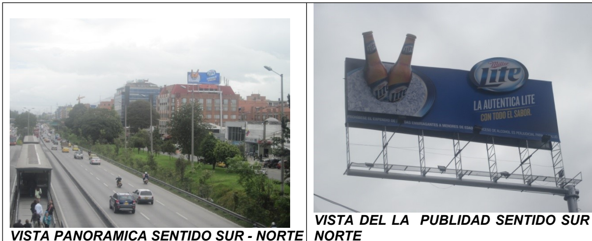
VISTA PANORAMICA SENTIDO SUR - NORTE